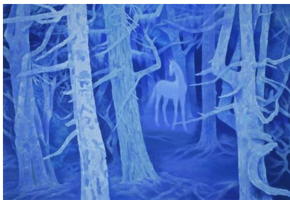
▲東山魁夷《白馬の森》昭和 47（1972）年 長野県立美術館蔵

今回の展示では、戦後日本を代表する日本画家・東山魁夷に注目。当館が所蔵する『春雪』、『秋深』とあわせて、長野県立美術館からお借りした『白馬の森』などを展示し、風景画の中に深い精神性を表現した東山芸術の世界をたどります。