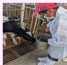
子牛とのふれあい体験

・協力企業等：東京ガスネットワーク、かずさDNA研究所など 計19企業・研究機関、25講座