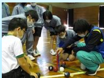
特別支援学校とのパラスポーツ交流