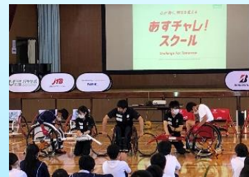
日本財団パラスポーツサポートセンターによるパラスポーツの体験等