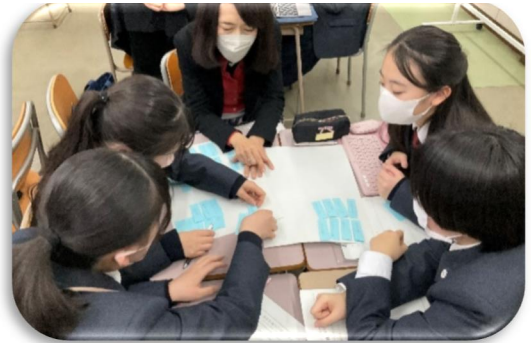
ブレインストーミングの手法で要因分析を行いました。