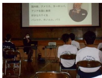
講師講話（客室乗務員）