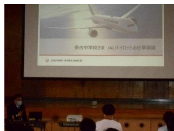
講師講話（パイロット）