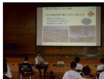
講師講話（空港職員）

本校の保護者や町民の中には、空港関係の仕事に従事している人がいます。今後も、地域の教育力を活かしたキャリア教育を推進していきたいと考えています。