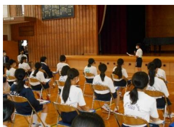
生徒代表お礼の言葉