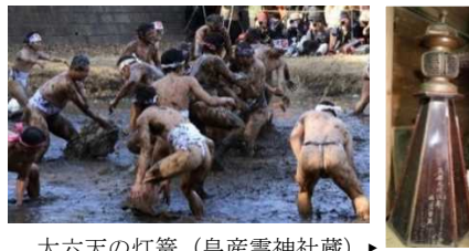
大六天の灯籠 (皇産霊神社蔵) ▶