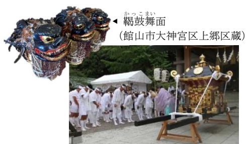
◀ 鞆鼓舞面 (館山市大神宮区上郷区蔵)