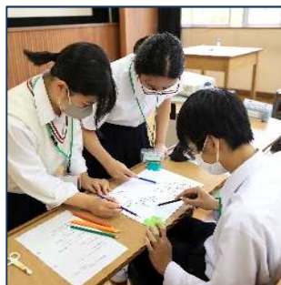
我孫子高校 教員基礎コース