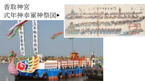
香取神宮 式年神幸軍神祭図▶