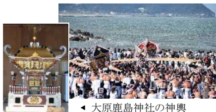
◀ 大原鹿島神社の神輿 (大原貝須賀区蔵)