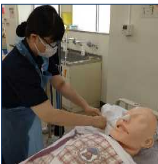
松戸向陽高校 福祉コース