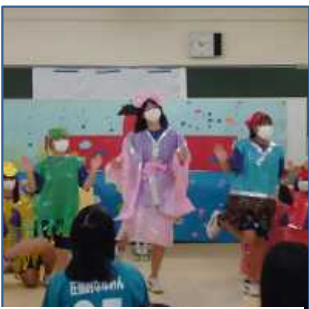
四街道北高校 保育基礎コース