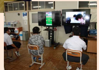
オンラインによる交流 (高等部)