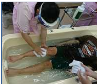
我孫子東高校 福祉コース