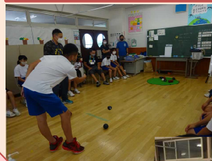
Tスローによる交流 (中学部)