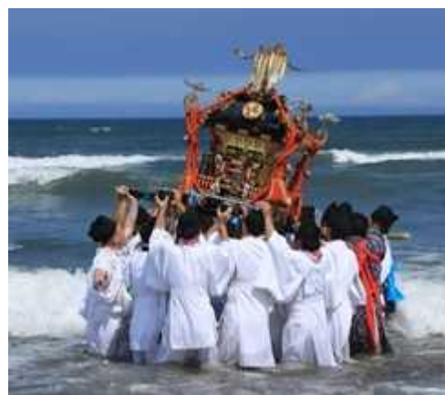
▲九十九里町真亀のおはまおり

展示では、県内約20カ所の「おはまおり」の神輿や、祭礼に使われる道具、絵馬などを展示し、その歴史や意義、魅力に迫ります。