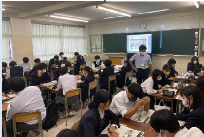
グループ別の意見交換