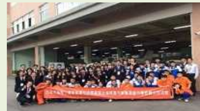
令和元年度 台湾との交流事業