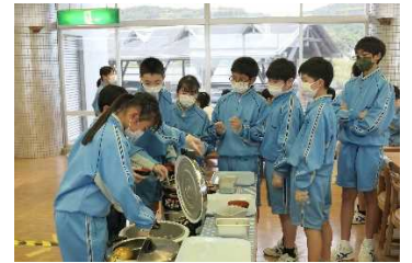
【オリエンテーション合宿】