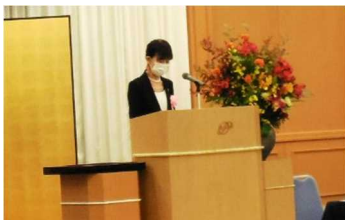
式辞を述べる富塚教育長

令和3年11月1日（月）に、ホテルポートプラザちばで令和3年度千葉県教育功労者表彰式が行われ、富塚教育長、井出教育長職務代理者が出席しました。