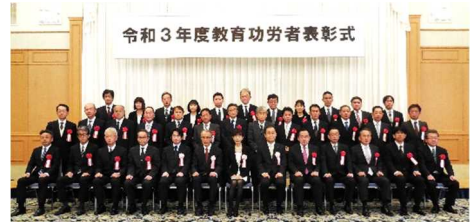
令和3年度教育功労者表彰式

受賞者との記念撮影：左「教育行政の部」「学校保健の部」「芸術・文化の部」「社会教育の部」の受賞者の皆さま 中「学校教育の部 県立学校（個人・団体）」の受賞者の皆さま 右「学校教育の部 市町村立学校（個人・団体）」の受賞者の皆さま