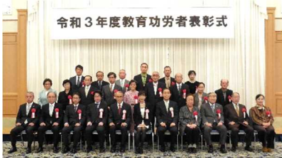
令和3年度教育功労者表彰式