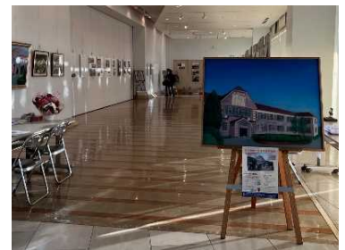
館山会場での写真パネル展の様子

日 時 11月20日（土）～11月28日（日） 午前9時～午後5時 ※月曜休館 場 所 道の駅きよなん案内所ギャラリー 安房郡鋸南町吉浜517-1 入 場 料 無料