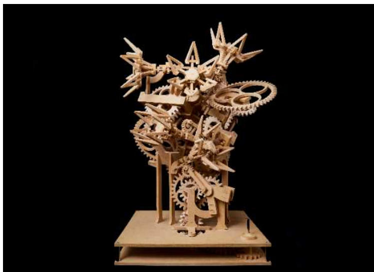
すすきかんご 鈴木完吾『秩序ある無秩序』 すがわらこうた 撮影：菅原康太