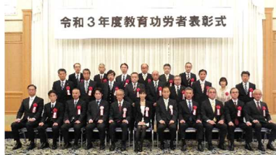
令和3年度教育功労者表彰式