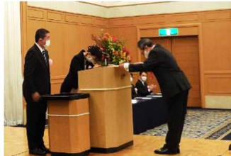
表彰状授与の様子