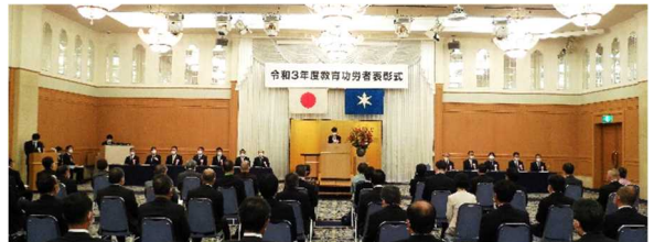
表彰式全体の様子