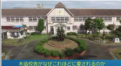
木造校舎がなぜこれほどに愛されるのか