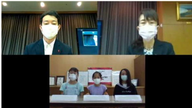
木更津市立清見台小学校児童とのオンライン懇談

両校は9月13日(月)にウェブ会議システムを活用して熊谷知事と富塚教育長に表敬訪問を行いました。