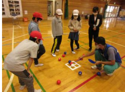
県立東金特別支援学校の取り組み

バリアフリーについてより具体的・現実的な解決方法を考えるためパラリンピアンと意見交換をしました。