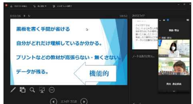
南房総教育事務所によるオンライン交流