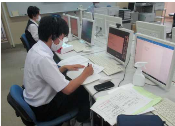
葛南教育事務所によるオンライン交流（八千代高校）