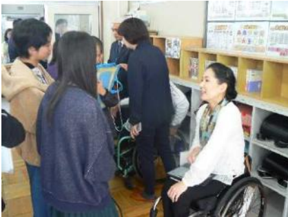
木更津市立清見台小学校の取り組み

*I'mPOSSIBLE アワード：パラリンピック・ムーブメントを通して、インクルーシブな世界の実現に多大な功績を収めた学校とパラリンピアンに贈呈される賞。この賞は、国際パラリンピック委員会が設立し、日本財団パラリンピックサポートセンターが支援を行っている。なお、『I'mPOSSIBLE』には、「不可能 (Impossible) だと思えたことも、ちょっと考えて工夫すればできるようになる (I'm possible)」という、パラリンピックの選手たちが体現するメッセージが込められている。