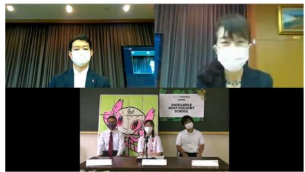
県立東金特別支援学校生徒とのオンライン懇談