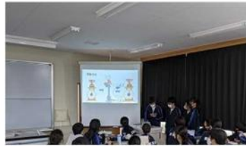
東葛中では3年間探求学習とプレゼンテーションを続けます

お問い合わせ先 千葉県立東葛飾中学校 電話 04-7143-8651 学校公式ホームページ