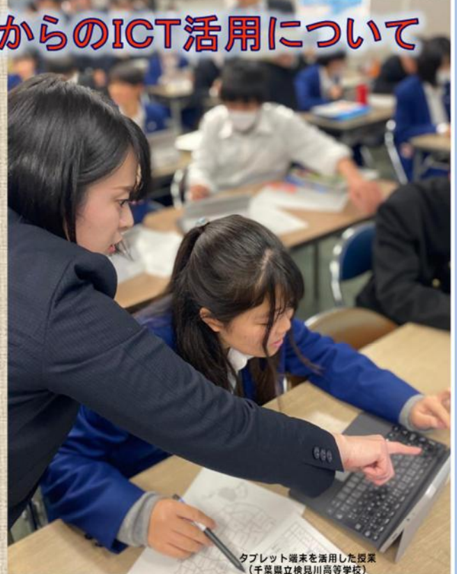
タブレット端末を活用した授業 (千葉県立検見川高等学校)

※3 Bring Your Own Device の略で、個人の所有する端末を持ち込むこと