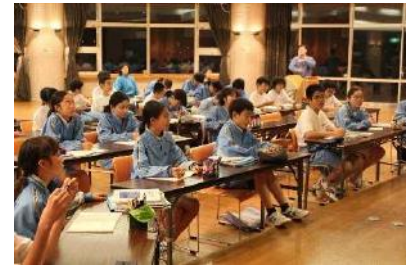
【オリエンテーション合宿】

なお、新型コロナウイルス感染拡大の状況によっては、当該行事の中止も想定されますので、本校HPをご確認ください。