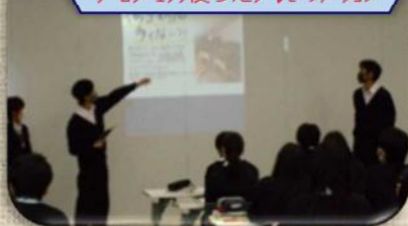
プロジェクタを使ったプレゼンテーション