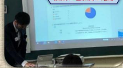
授業の理解度を確認