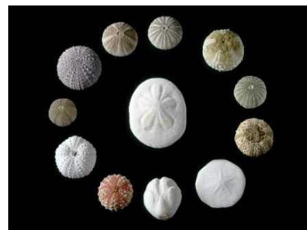
さまざまな種類のウニの殻

本展示では、海からの贈り物、海の生きものの殻について、さまざまな角度から紹介します。