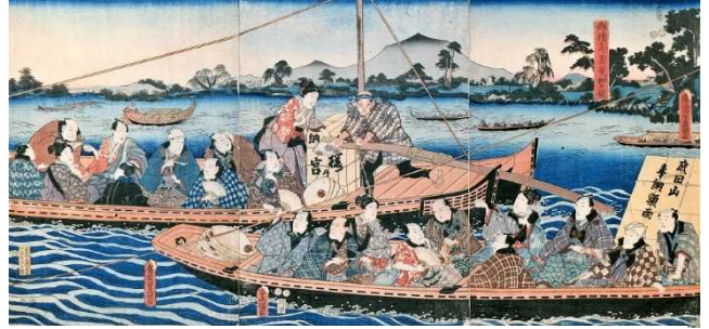
御礼参り最良 (ひいき) 船之圖 成田山靈光館蔵

船が交通の主役だった時代は、多くの人が船で旅に出掛けました。そんな時代の旅の様子をパネルで紹介します。