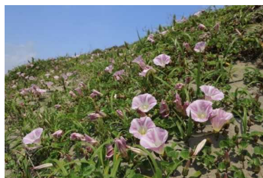
砂浜に咲くハマヒルガオ

あまり知られていない砂浜の動植物の多様性や、砂浜と人との関わり、現在九十九里浜に迫っている危機について、ご紹介します。