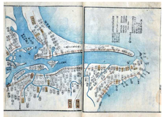
「利根川図志」(当館所蔵)

利根川下流域の千葉県と茨城県の境である「ちばらき」。主に当館に収蔵されている資料を用いながら、古代からの歴史の変遷について紹介します。