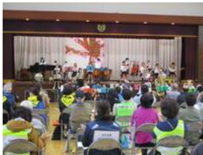
流山本町合同防災訓練