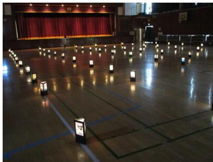
流山本町ひな巡りの会