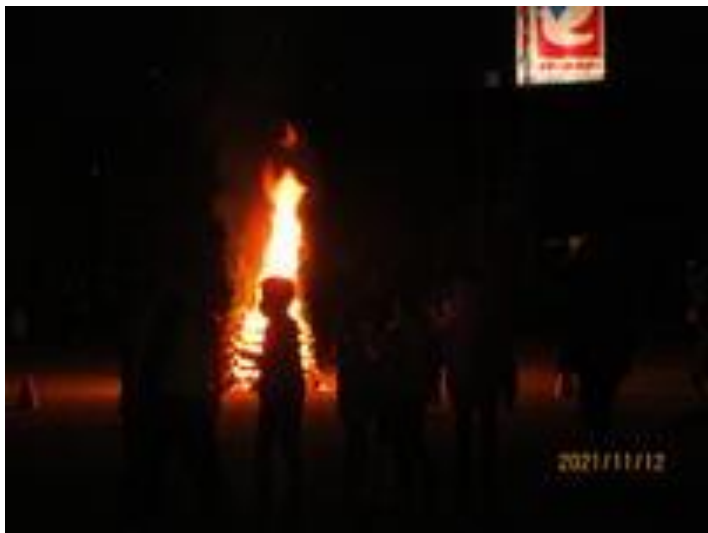
校内キャンプ ファイヤー