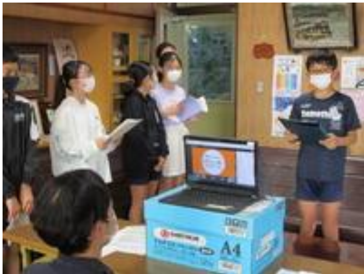
創立150周年記念行事