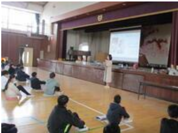
南流山こども食堂の方の講話