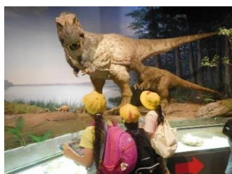
3年 校外学習(茨城自然博物館)