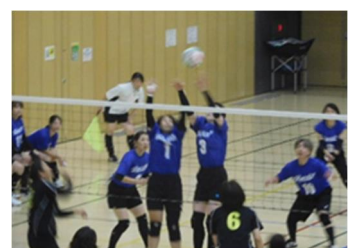
PTAバレー東葛大会進出