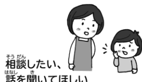
そう だん 相談したい、 はなし 話を聞いてほしい