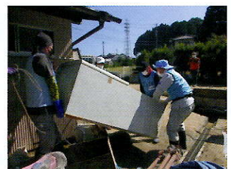
静岡県磐田市、令和4年台風15号災害でのボランティアのようす

「災害等準備金」が災害ボランティアセンターを支えているのとは別に、直接ボランティア活動を行うNPOなどに対して、活動で使用する機材の整備費や、ボランティアがうまく働けるようコーディネートを行う人たちの活動費として助成が行われます。