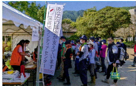
静岡県静岡市、令和4年台風15号災害での災害ボランティアセンター