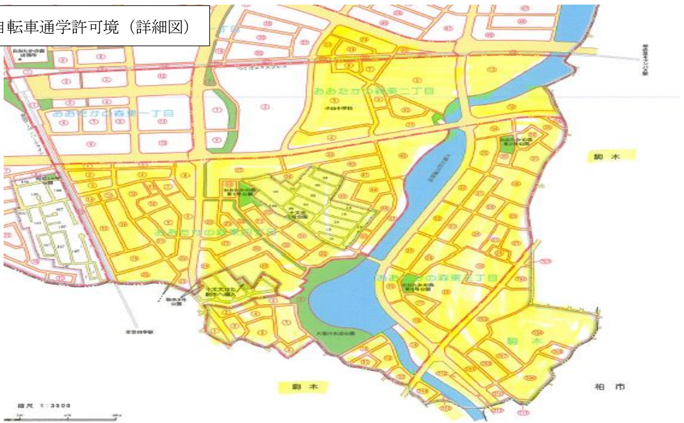
自転車通学許可境(詳細図)