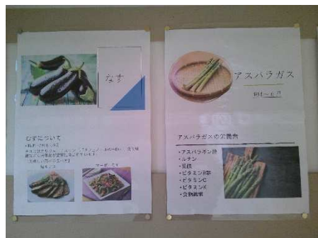
【なす・アスパラガス】