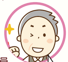
西初石地区青少年補導員

青少年環境浄化の取り組みは、各店舗や、関係する大人が協力しやるべきことを考えることです。これからも地域の皆さまのご協力をよろしくお願い致します。