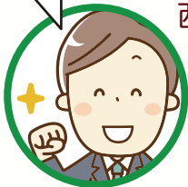
西初石中学校 学校補導員

子ども達が安心して学校生活を送ることができるよう、地域の皆様と一体となって見守り声掛けしていきたいと思えます。