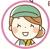
西初石中学校PTA補導員