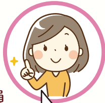
西初石小学校 学校補導員

子ども達の様子を温かく見守って頂きありがとうございます。子ども達の安心安全のため、尽力してまいります。