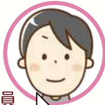
西初石中学校区民生委員児童委員

子ども達が安心して生活出来るよう見守り活動をしています。 気になることがありましたらお声かけ下さい。