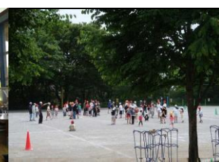
1・6年 ふれあい活動