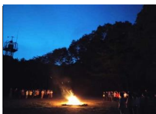
5年林間キャンプ ファイヤー