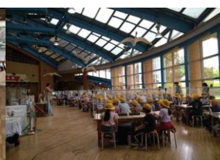
2年 アンデルセン公園