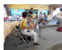
大会に向けて部活動支援