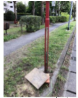
落ちてしまった看板

危険箇所の立て看板の追加・破損調査をしています。経年劣化により落下していた看板を回収しました。もし暴風などで落下した危険な看板を見かけましたら校外補導委員までお声がけください。