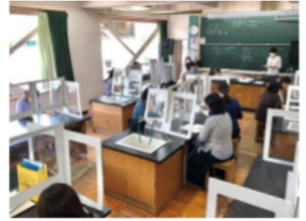
選考改革委員会引き継ぎ会の様子