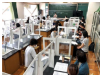
学校活動支援委員会引き継ぎ会の様子