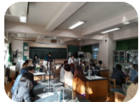
2月動画配信練習会