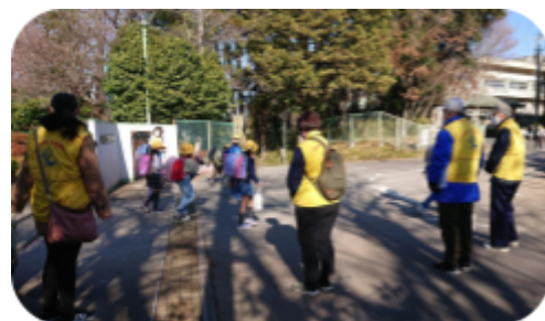
下校時見守りの様子

12月23日(木)に年内最後の支部会議と支部パトロールを行いました。本来であれば、終業式啓発活動を行う予定でしたが変更となったため、パトロールの範囲を西初石小学校付近として下校時に補導員で生徒の見守りを行いました。