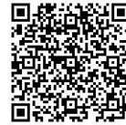
問い合わせ メールアドレス