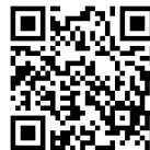
サポート登録 Google フォーム

図書室サポート以外の活動につきましては活動予定が決まり次第、登録して頂いた方にお知らせします。