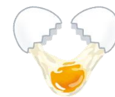
卵 (うす焼き卵や温泉卵、ゆで卵) (たんぱく質)