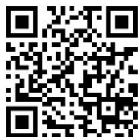
問い合わせメールアドレス

問い合わせメールアドレスが nanryu2018@gmail.com に変わりました。 学校支援ボランティアの皆様へのご連絡もこちらのアドレスからになります。 よろしくお願いいたします。