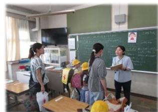
「いざはふだんから」土曜授業参観後の引き渡し訓練ご協力ありがとうございました