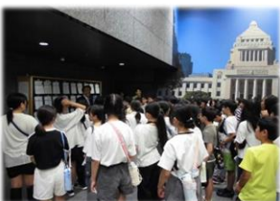
6年生 校外学習「科学技術館」「国会議事堂」最高学年らしい参加態度が立派でした