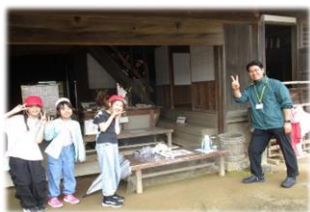
4年生 校外学習「房総のむら」雨でも元気いっぱい！千葉の昔の暮らしを体験してきました