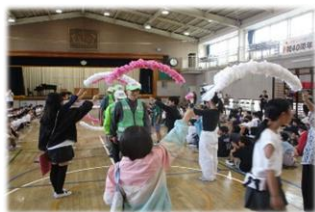
安全見守りをして下さった地域ボランティアの方々を全校集会にお招きし感謝の気持ちを伝えました

今年度から、通知票を前期(10月10日配付)・後期に配付させていただくことになりましたので、夏休み前に通知票の配付はありませんが、夏休みに入る前に、子供たち一人ひとりと担任が面談し、1学期に頑張ったことを伝えたり、困っていることを聞いたりする機会を持ち、夏休みの過ごし方についてお話をさせていただきます。保護者の皆様にも、1学期のお子様の様子を7月下旬の個人面談にて共有させていただきたいと存じますので、暑い中のご来校となりますが、どうぞよろしくお願い致します。