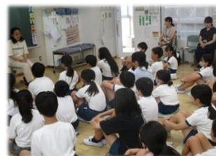
学年のクラスでは「おはなしの花束」さんによる「おはなし会」が始まりました(7月に続きます)

来たる夏休み、子供たちには、ゲームやインターネットから少し離れて、自然や人とのふれあいや、家庭での手伝い、興味のあることの探究や地域行事への参加、身体を使った遊びや運動などを通して成長してほしいと願っています。