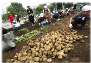
5年生 ジャガイモが大量に収穫でき、給食で2回提供し、調理実習でもカレー作りに使いました