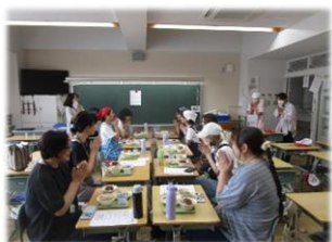
4年・6年の校外学習の日に給食試食会を行いました 美化活動もありありがとうございました