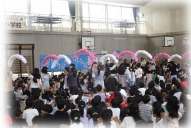
▲4年生の花のアーチをくぐって入場する

4月28日開催の「1年生を迎える会」では、2年生から「朝顔のたね」3・4年生から「手作りペンダント」、5年生から「学校クイズ」のプレゼントがあり、6年生は1年生と手をつないで一緒に入場しました。1年生のお礼の発表は、元気いっぱいの歌と振り付けで上級生の目をくぎ付けにしました。全校児童が一堂に会して1年生を温かく迎えることができました。