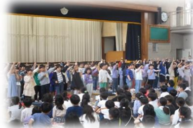
▲1年生からのお礼の発表