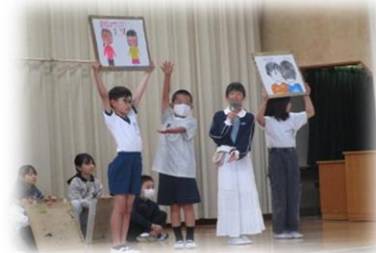
▲5年生による南流小クイズ