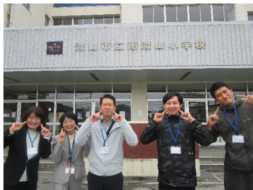
▲新しい南流山小学校のリーダーズです

★部活動を放課後中心に行います(部活動指導【運動部】(陸上・ミニバス)【音楽部】【自転車部】)にボランティアでご協力いただける方がおられましたら、学校支援コーディネーターまたは教頭までご連絡ください。