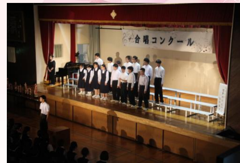
わかくさ「世界がひとつになるまで」