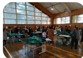
賑わう場内 外にはバザーを待つ人の行列も！