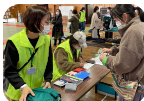
来場者の方は小銭やエコバックを持参いただくなど、ご協力いただきました