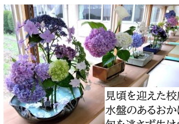
見頃を迎えた校庭のあじさいを自由に。水盤のあるおかげで匂を逃さず生けられます。