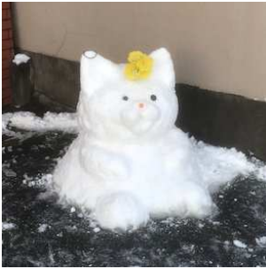
通学路で虎に会いました。

あけましておめでとうございます。保護者の皆様、地域の皆様におかれましては、新年をお迎えして喜びや希望に満ちていることと存じます。皆様にとって本年も幸多き年になりますようご祈念いたします。本年も昨年同様ご支援ご協力を賜りますよう、よろしくお願いたします。