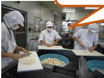
里芋(千葉県産)を切っています

「十五夜」は、日本では、稲穂に見立てたすすきと収穫された里芋などをお供えて、秋の実りをお祝いする伝統があります。そのため、「いも名月」と呼ばれることもあります。