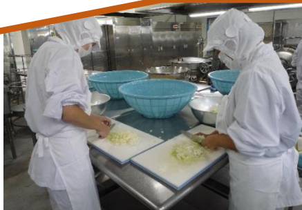
長ねぎを切っています