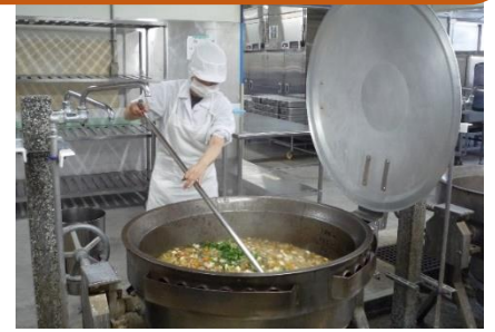
けんちん汁を仕上げています