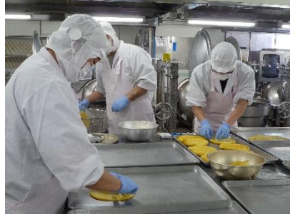
薄焼きたまごを1枚1枚はがして、折りたたんでいます