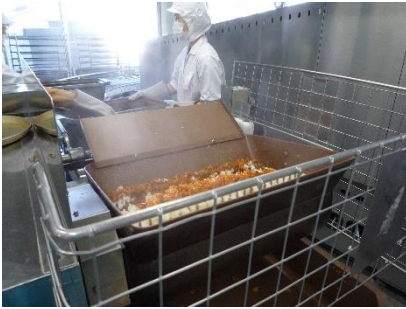
ごはんを混ぜています

お皿にチキンライスをのせ、その上に薄焼き卵をのせて、トマトケチャップをかけて食べます。