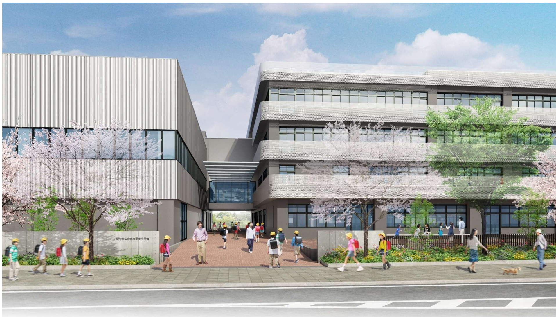
正門からみた校舎イメージ

大きな開口部からは、児童の活動の様子が感じられ、明るく開かれたイメージをつくります。