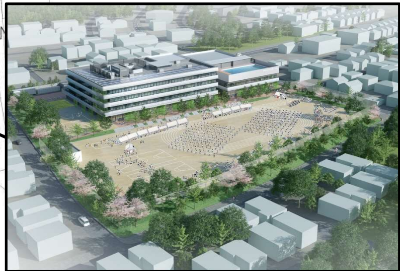
広いグラウンドイメージ