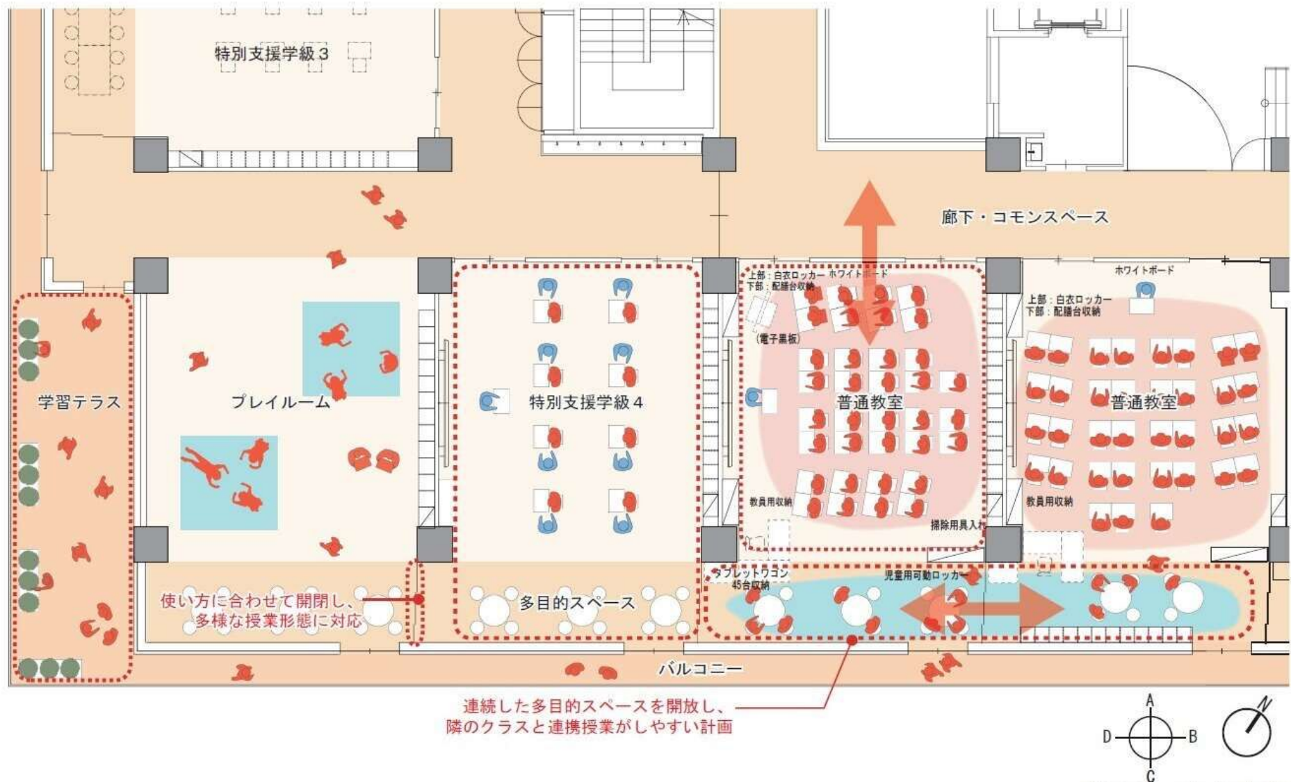
普通教室・多目的スペースの使い方イメージ