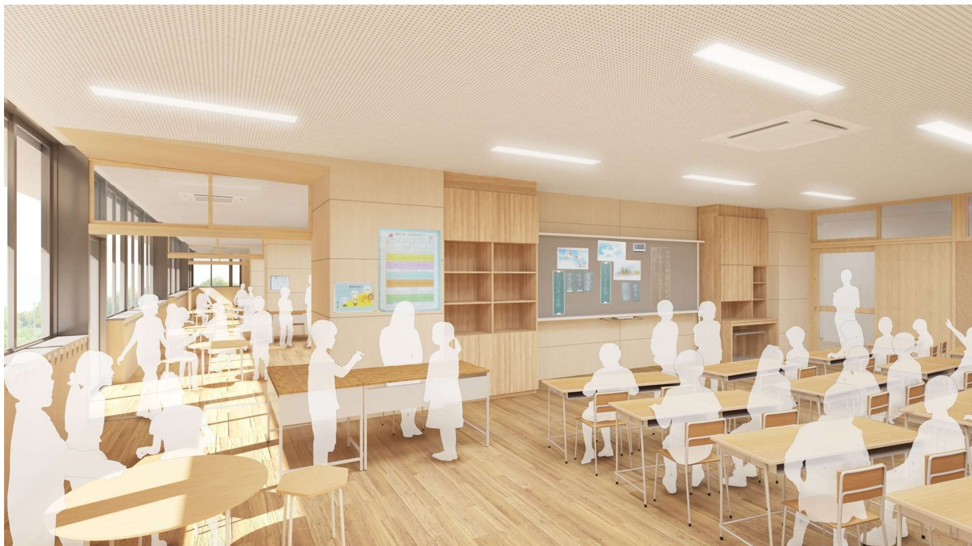
普通教室・多目的スペースイメージ