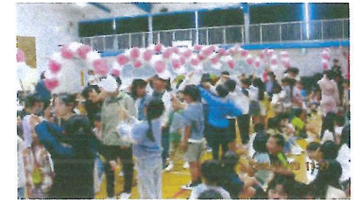
1年生を迎える会の退場の様子