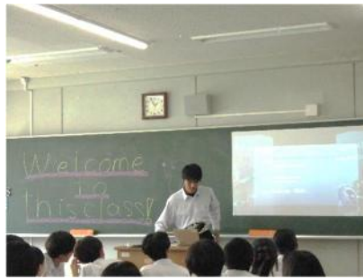
磯辺高校の生徒が日本文化の魅力をプレゼン