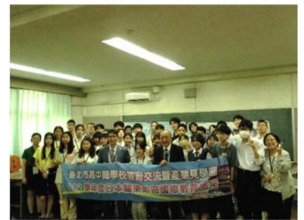
全員による記念撮影