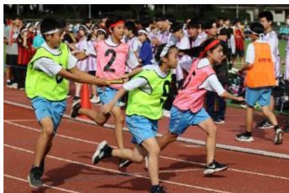
【体育大会（中高合同）】