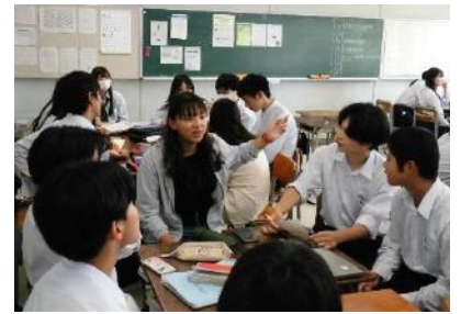
グループにてコミュニケーションを図る生徒たち