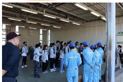
空港で使用されている特殊車両の乗車体験