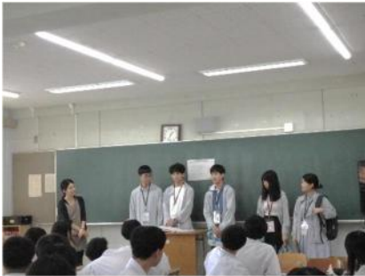
一人ずつ自己紹介をする台湾の生徒たち