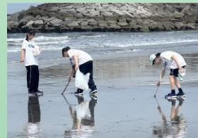
暑い中、頑張りました!