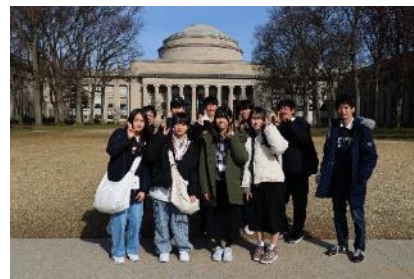
【海外異文化学習（3学年希望者）】