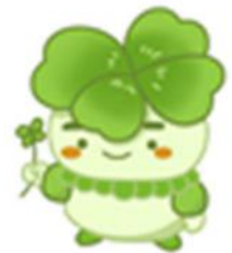
千葉県子どもと親のサポートセンター マスコットキャラクター こさぼん