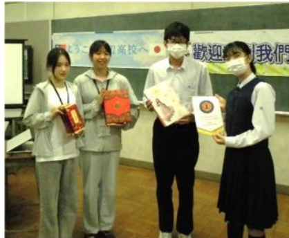
代表生徒による記念品交換