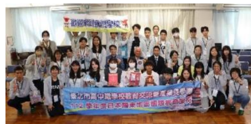
緑和会(生徒会)生徒と 台湾生徒による集合写真