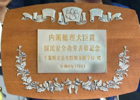
総理大臣官邸2階大ホールでの表彰式後の記念写真撮影に臨む長生特別支援学校長(最後列左)/左下:表彰状/右下:記念盾

政府は、交通安全や火災予防などに貢献した個人及び団体を発表し、7月1日(月)に総理大臣官邸で表彰式を行いました。