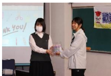
代表生徒による記念品交換