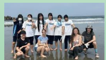
海をバックに記念撮影!