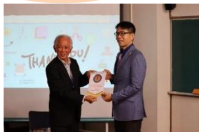
長野校長先生と陳徳貴先生 による記念撮影