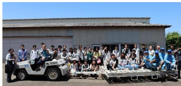
3年生自動車科の生徒と台湾生徒による集合写真