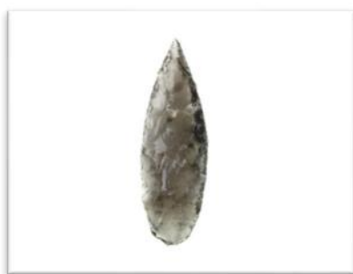
せんとうき 尖頭器 (内山遺跡 (柏市))

注1「旧石器時代」約3万8千年前～約1万6千年前 注2「縄文時代」約1万6千年前～約2,300年前