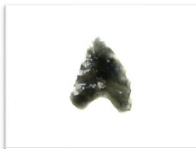
いもくぼはら 矢じり (芋窪原遺跡 (君津市))