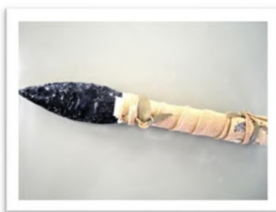
やりさきがた 槍先形尖頭器 (復元)