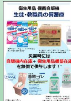
衛生備蓄庫ポスター

各学校のウェブページから「県教委ニュース」へのリンクをお願いしています。バナーもご活用ください。