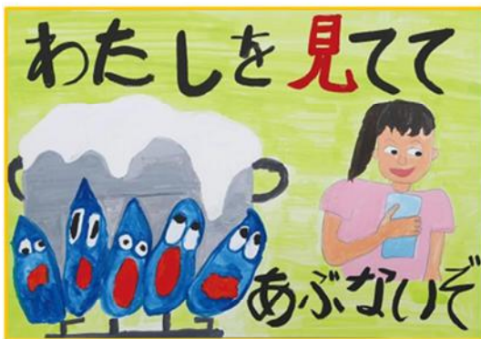
小学校低学年部門