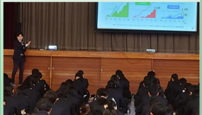
講座「ライフプランとお金」の様子

「ライフプランとお金」と題し、講座やグループワークなどを行い、「お金」にまつわる知識を広げるとともに、夢の実現のために継続して努力することの大切さを実感する貴重な機会となりました。教職員も参加者として生徒とともに議論を行うなど、活発なやり取りがありました。