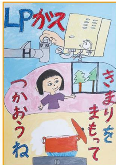
小学校高学年部門