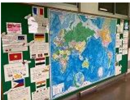
日本語指導教室前の掲示物