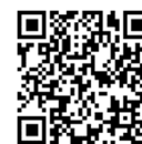
ワンストップ・オンライン相談 二次元コード

◇ホームページのURL: https://cms2.chiba-c.ed.jp/kosapo/reserve_online