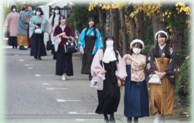
自ら製作した和服を着装して登校。反物を購入して、手縫いした作品です。早起きして自分で着付けました。

県内公立高校唯一の服飾専門学科である服飾デザイン科は、2年次から和裁コースと洋裁コースに分かれて、より専門的な学習に取り組んでいます。