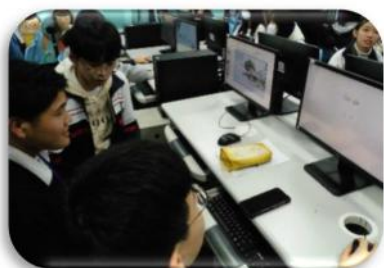
ICTを使用したグループ学習