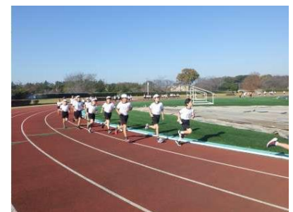
150周年記念持久走記録会