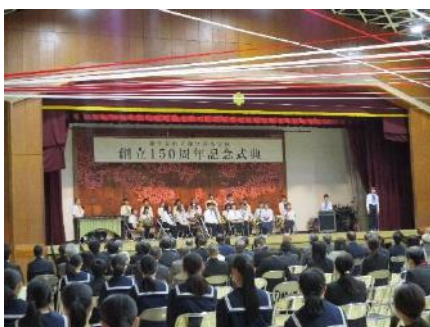
創立150周年記念式典

令和5年12月に、県内各地から本校に関わる方々や本校を支えていただいている地域の方々、教育関係者の方々をお招きし、創立150周年記念式典を開催しました。