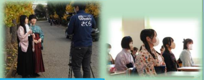
インタビューの様子です。作品に対する思いや、和服で登校した乾燥についてカメラに向かって答えます。