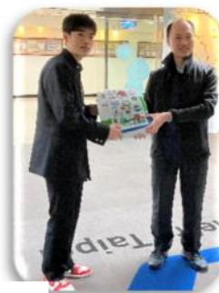
生徒によるお礼の言葉