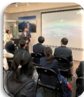
BROGENT デジタルコンテンツを使用 したアミューズメント系企業