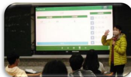
バイリンガル（中国語・英語）での授業