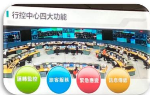
台湾 METRO 台湾でデジタル化を進めた 鉄道会社