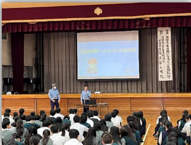
県立匝瑳高等学校で行われたヘルメット着用を促す全校集会