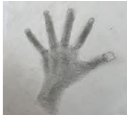
児童が描いた自分の手

さらに、今年度、乗り入れ授業を受けた児童が本校の1年生として入学し、現在ほとんどの生徒が元気に中学校に登校してくる姿が見られ、乗り入れ授業の感想の中にも「中学校でどんな授業をしているのかが分かった」というものがあつたことから、中1ギャップの解消に大きくつながったように感じています。教員も入学前の生徒の様子を知っていること、生徒も入学前から中学校の教員や、授業の雰囲気を知っていることは、非常に大きな影響があると思われまふ。