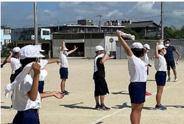
タオルを使ったボール投げの練習

乗り入れ授業は、中学校教員の専門性を生かすというねらいで、そのとりかかりとして体育科（ボール投げ）と図画工作科（デッサン）で行いました。技術的な指導を中心に行った結果、児童にその感想を聞くと「前よりもできるようになった」といった意見が多く出ました。