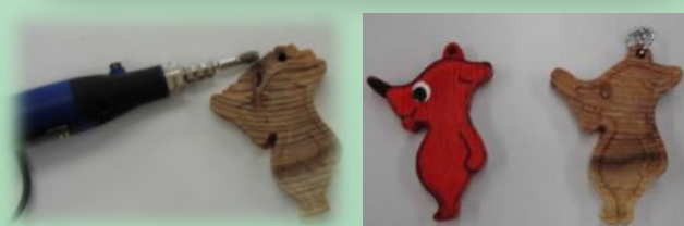
ルーターと呼ばれる機械を使って丁寧にバリ（角）を取ります。