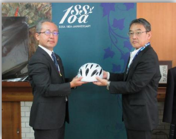
県教育委員会によるヘルメット贈呈

県教育委員会から、モデル校にヘルメット20個を支給し、ヘルメット着用推進に活用します。（支給したヘルメットは、秋山サイクル〔浦安市富士見〕から寄贈いただきました）