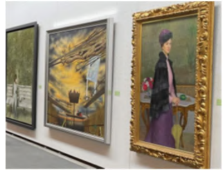
昨年度の県展の様子

プロの芸術家と同じ展覧会で展示される貴重なチャンスです。ぜひ、チャレンジしてください。