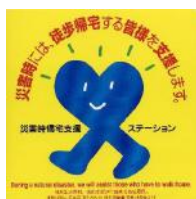
○コンビニエンスストア等

* 2 九都県市 千葉県、埼玉県、東京都、神奈川県、千葉市、さいたま市、横浜市、川崎市、相模原市