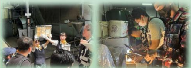
大高醤油株式会社を ガイドする生徒たち