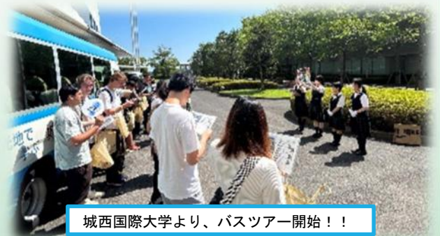
城西国際大学より、バスツアー開始！！

今回は、一般の方を招いてのツアーを実施する上での事前学習として、城西国際大学の留学生を対象としたバスツアーを実施しました。