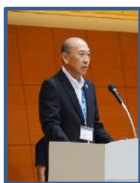
【選手激励】中西教育振興部長