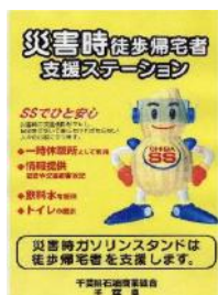
○千葉県石油商業組合に加盟する県内のガソリンスタンド

この件についての問合せ先 防災危機管理部危機管理政策課 電話043-223-3404