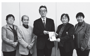
白沢赤十字奉仕団 様

匿名.....タオル・洗剤 二本松信用金庫 様(二本松市)・・・フリーズドライご飯300食