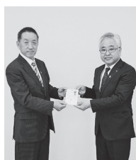
二本松優良申告法人のつどい 様 産業祭実行委員会 様