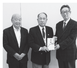
本宮市まゆみクラブ連合会 様