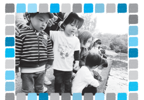
遠足（蛇の鼻遊楽園）