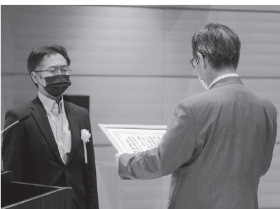
感謝状を受ける アルス株式会社様