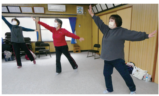
ダンスの曲はお馴染みの昭和歌謡♪

加齢に伴い足腰の筋力低下を心配した地区の方々の「何か身体を動かしたい」という声をきっかけに、月2回、本宮9区集会所で、音楽に合わせて無理なく運動できる健康体操ダンスを行っています。