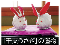
「干支うさぎ」の置物

普段からお互いによく交流しているつながりの多い地域には、元気で健康な人が多いですね。健康とは、病気でないことだけではなくありません。自分一人だけで頑張るよりも、みんなで元気になることが大切です。つながることは、友だちがいて、役割があって、地域に自分の居場所があることです。今回はみんなで集まって、楽しく活動している ふたつのグループを紹介します。