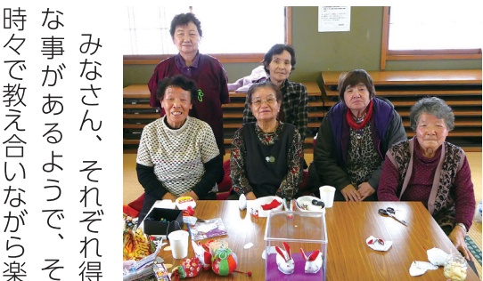
作った作品は秋の文化祭に出展します

みなさん、それぞれ得意な事があるようで、その時々で教え合いながら楽しく手を動かしています。