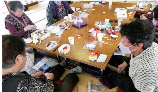
「そこは二重になるように縫うんだぞい」

30年以上前に婦人会を退会した方たちで発足した会です。現在は6人が定期的に集まっています。