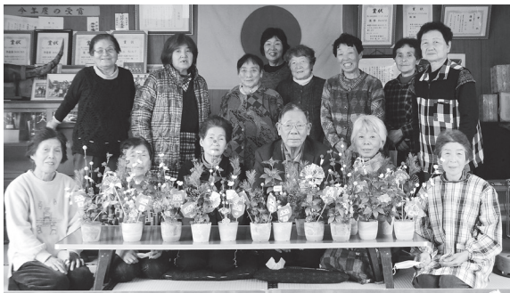
きれいな花かざりができました