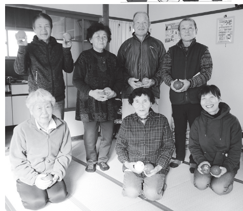
ボッチャは誰でも楽しくプレイできますよ

12月14日、ふれあいサロンで今注目のスポーツ「ボッチャ」を行いました。 青田小池サロンでは、今回が3回目。参加されていた方々も基本的なルールはすでに分かっており、ゲームはナイスプレーの連続でした。 「相手のボールに当てて遠ざければいいんだけど、そうねらい通りにいかないね」と笑い合い、楽しい時間を過ごしました。