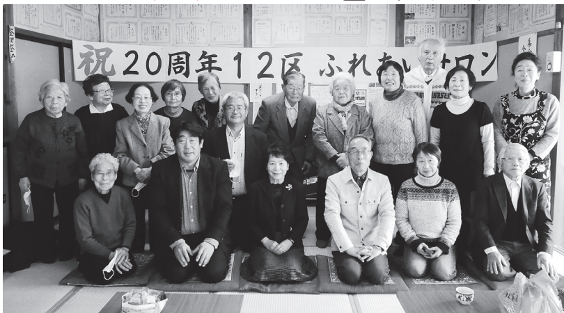
12月16日、コロナの影響で延期になっていた20周年セレモニーが開催されました