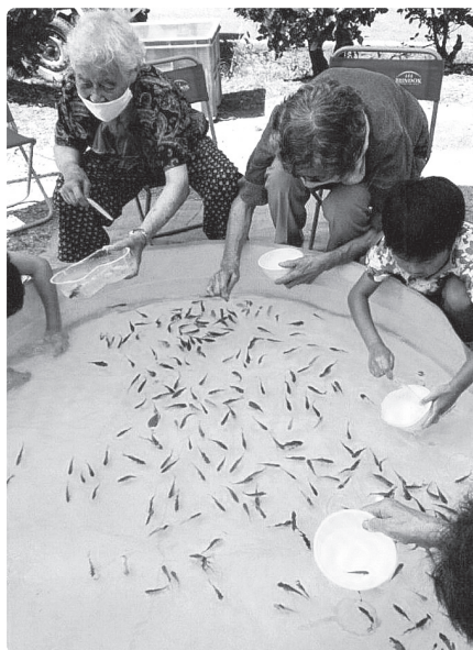
「やったー！見て見て1匹すくえたよ！」