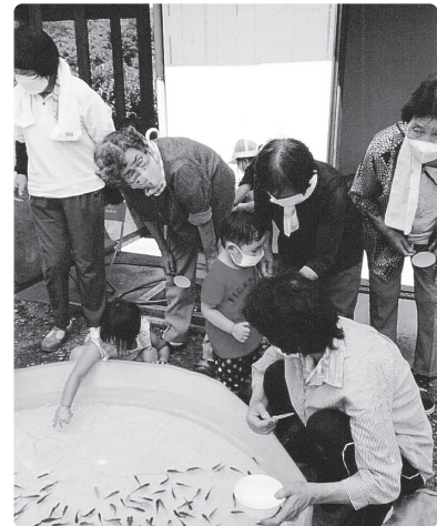
小さな子どもからお年よりまで参加しました

8月4日、夏休みの真っ最中に、地区の子どもたちも大勢参加して納涼会を開催しました。集会所の軒先に幼児用プールを設置して行った金魚すくい、子どもたちはもちろん、大人も本気になってチャレンジしていました。「狙ってたのに、逃げられた」と、その度に笑いが起こります。