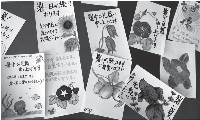
色鮮やかな「暑中見舞い」ハガキ、がたくさん集まりました