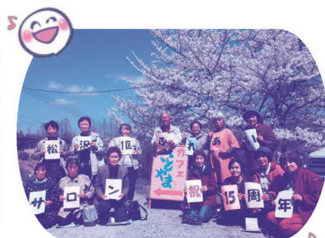
地域の憩いの場“ふれあいサロン”

自分のまちを良くするしくみ 本宮市共同募金委員会は、令和5年度も『赤い羽根 勇気と優しさ 助け愛』をスローガンに「赤い羽根共同募金」を展開しました。 市内でご協力いただいた寄付金から約6割が本宮市に配分され、市の地域福祉のために使われています。