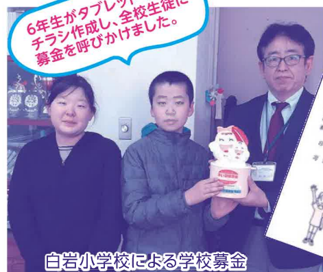
白岩小学校による学校募金