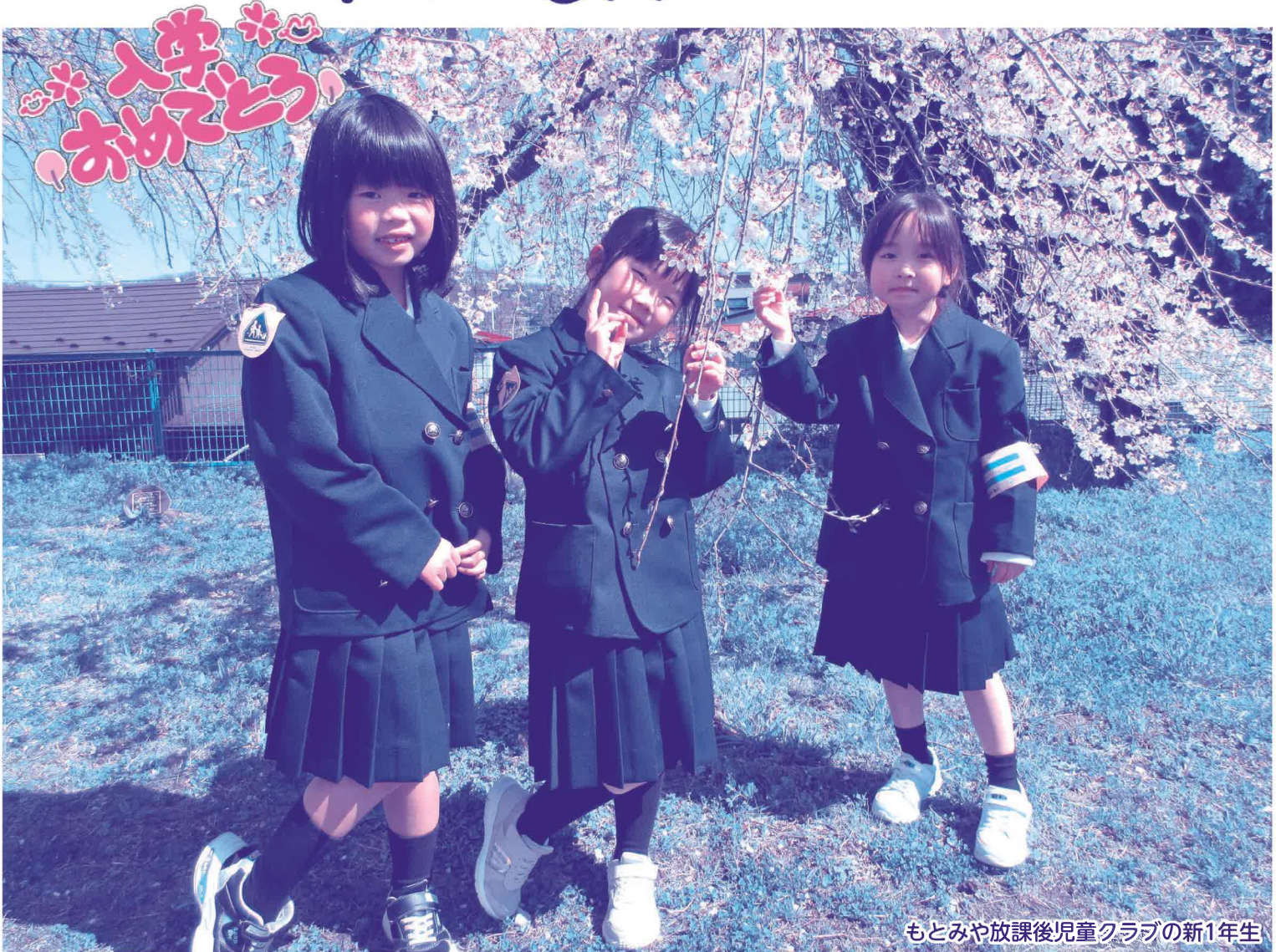
もとみや放課後児童クラブの新1年生