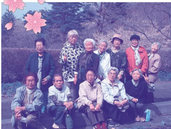
桜の下でハイポーズ!