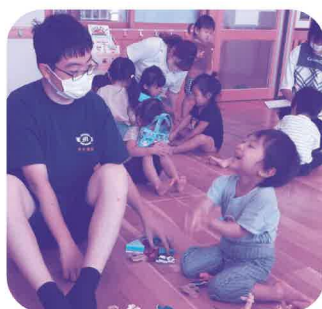
楽しさいっぱい “夏体験ボランティア”