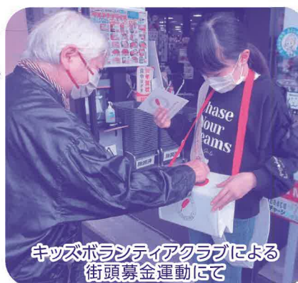
キッズボランティアクラブによる 街頭募金運動にて