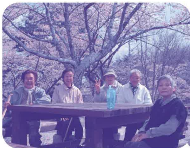
ちょっとひと休み