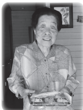
「ごちそうになります」とニコリ

今回は、職員が利用されている皆さんの元気な姿を確かめながら、市内のお店で調理した仕出し弁当を配達しました。季節の食材を使い、食べやすいよう柔らかめに調理され、目でも楽しめるような色鮮やかな弁当に仕上がりました。