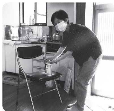
会場に来たら、手指を消毒します

6月10日、和田1区ふれあいサロンが三カ月ぶりに開催されました。この日を楽しみに集まった参加者は11人。入口でしっかりと手指の消毒をしてから会場に入りました。集会所の窓はすべて開け放たれ、夏目となったこの日も室内には初夏の爽やかな風が吹き抜けていました。