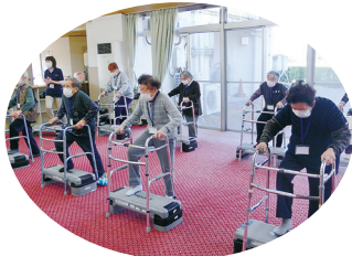
歌に合わせて♪ステップ運動