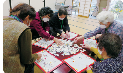
頭の体操！みんなでワイワイ！！