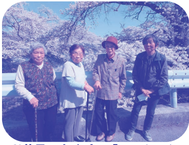
お花見に出かけて「ハイチーズ」