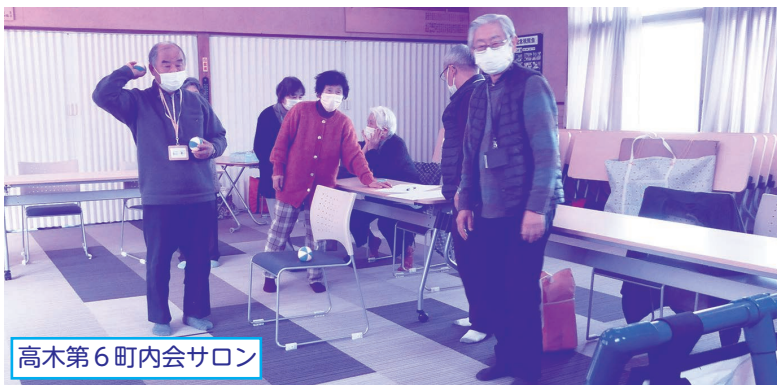
高木第6町内会サロン

主に集会所等を利用して、月に1〜2回、気軽に集まり、みんなで交流を楽しみます。また、ボランティアによる余興や様々なゲームなどを一緒に楽しむことで親睦を深め、地域の連帯感を促進します。