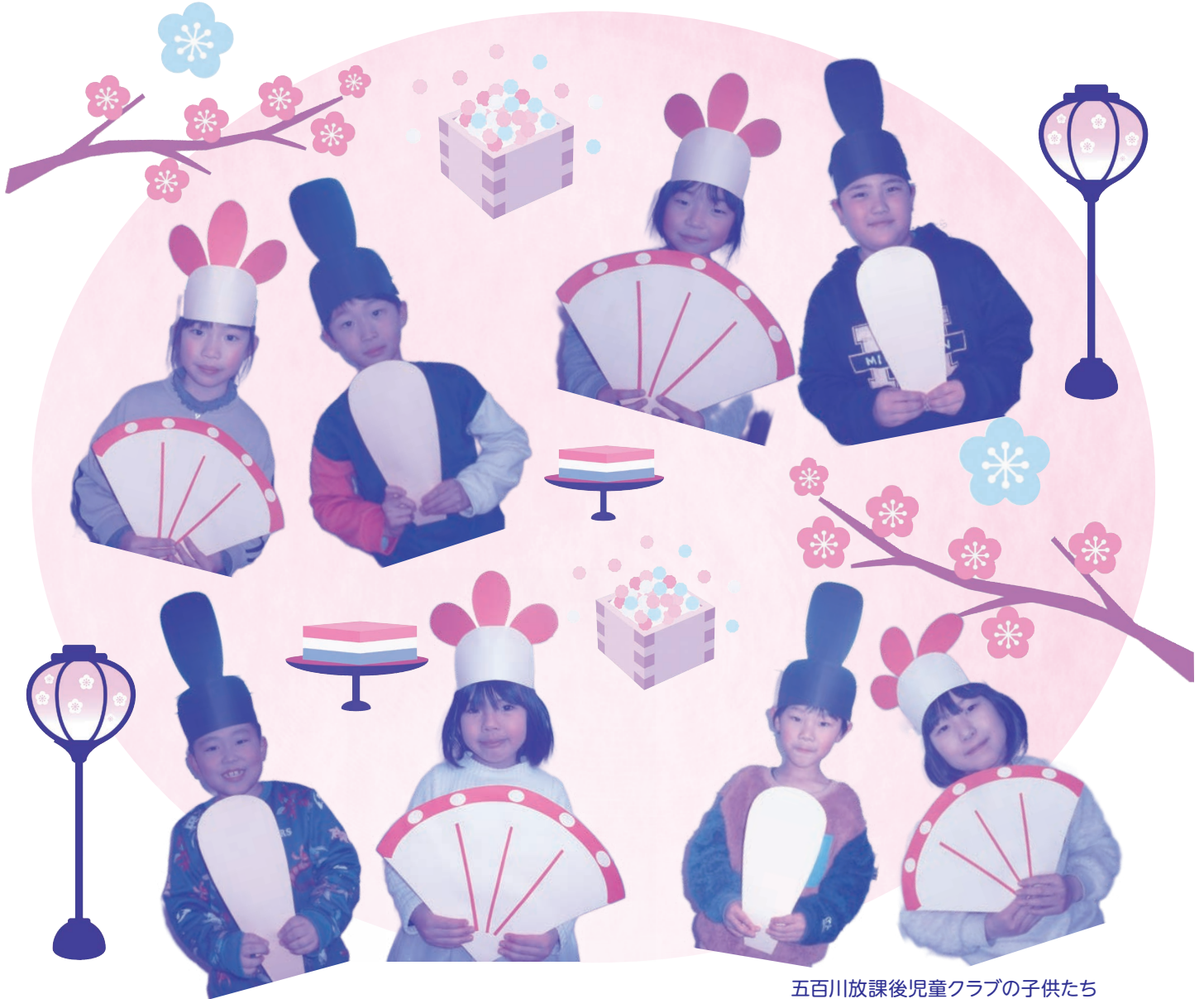
五百川放課後児童クラブの子供たち