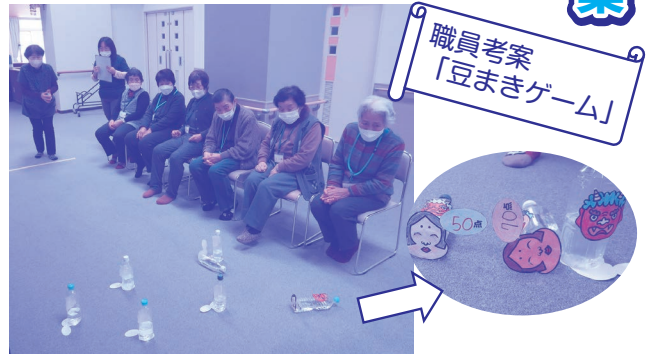
ペットボトルの鬼を倒すと点数がもらえます。