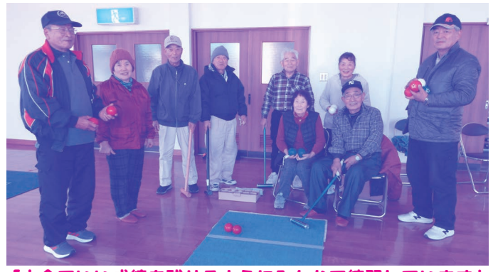
「大会でいい成績を残せるようにみんなで練習しています」