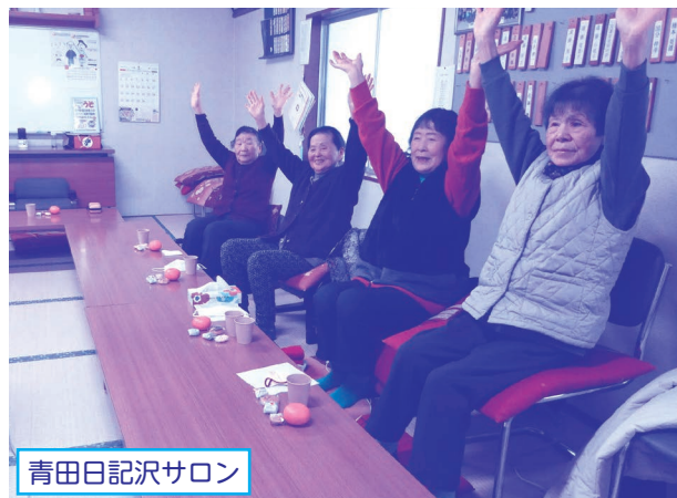
青田日記沢サロン