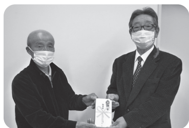
産業祭実行委員会 様