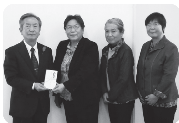
白沢赤十字奉仕団 様