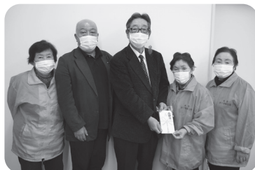
本宮赤十字奉仕団 様